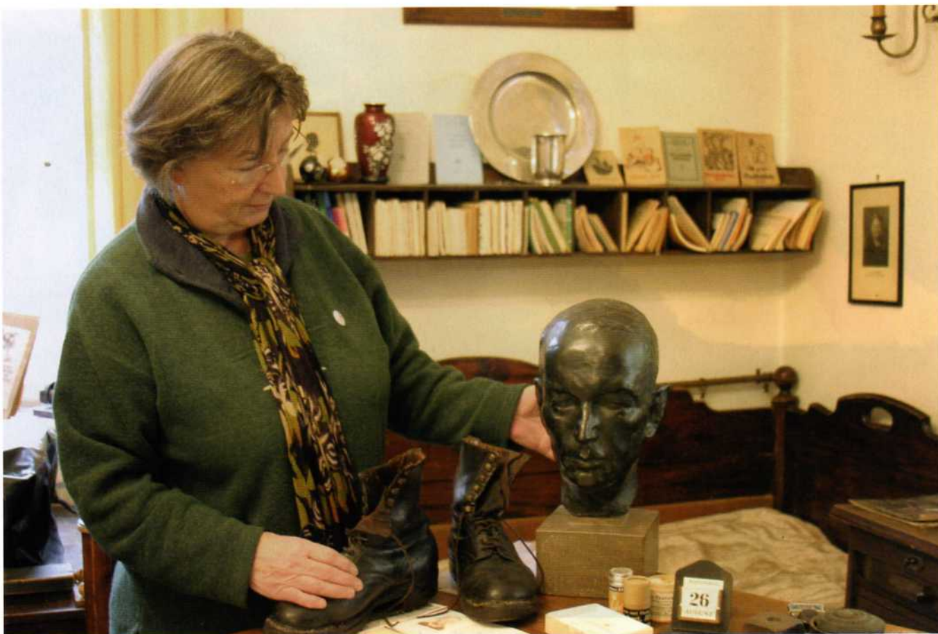
Könnten seine Wanderschuhe plaudern...