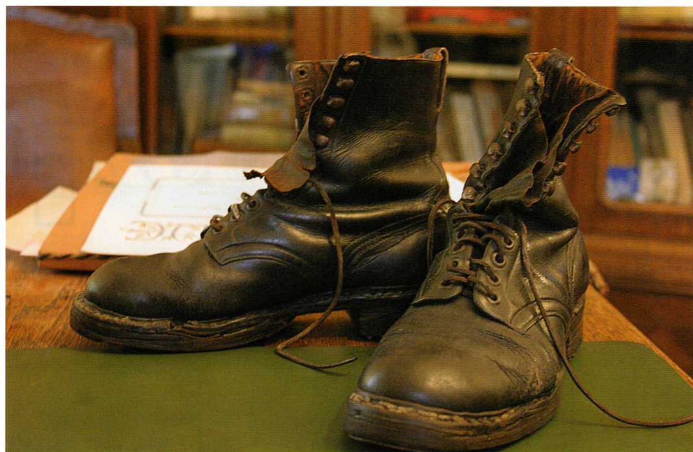
Richard Schirrmanns Wanderschuhe, die er 1903 eigens hatte anfertigen lassen, können im Privatmuseum noch besichtigt werden.

gentlich, sagt sie nachdenklich, seien die Probleme von damals heute immer noch aktuell, auch wenn der Heusack in den Betten der Jugendherbergen durch eine bequeme Matratze ersetzt worden sei und es mittlerweile Zimmer mit Dusche und WC gebe. „Aber der Inhalt zählt noch“. Natürlich sei die Organisation heute moderner, aber sie stehe noch in enger Verbindung mit dem Gründungsgedanken.